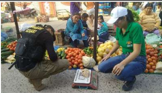
Control de peso en la feria dominical, para garantizar al consumidor.