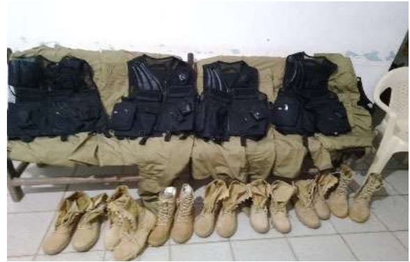
Adquisición de prendas de vestir para gendarmes