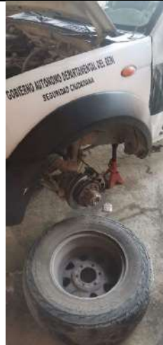
Mantenimiento de movilidades de la policía nacional.