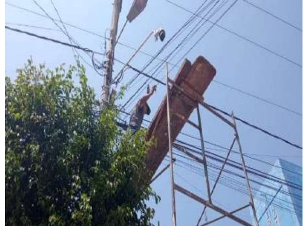
Mano de obra servicio mantenimiento correctivo de 9 cámaras software y hardware de los sistemas de monitoreo de Rurrenabaque