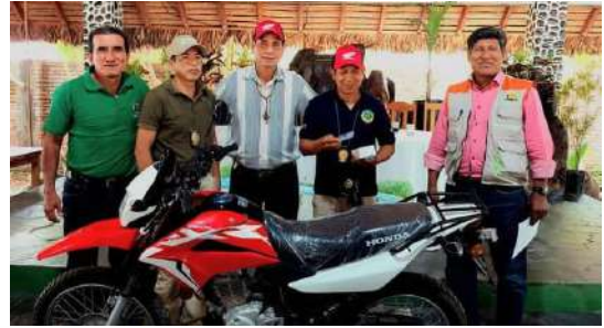
Adquisición de una motocicleta honda xr.150 nueva para la FELCV