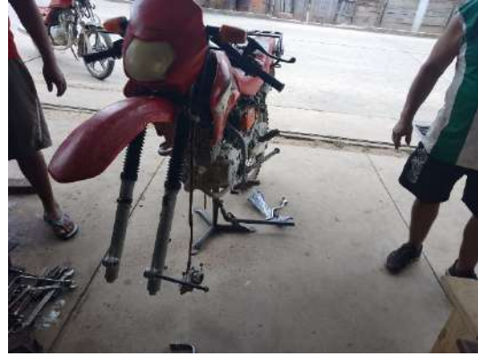
Mantenimiento de motocicletas de la policia nacional.