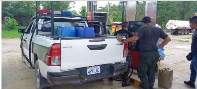
Entrega de combustible a la policía Nacional.