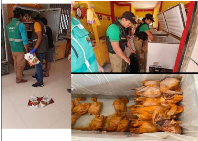
Inspección de diferentes friales.