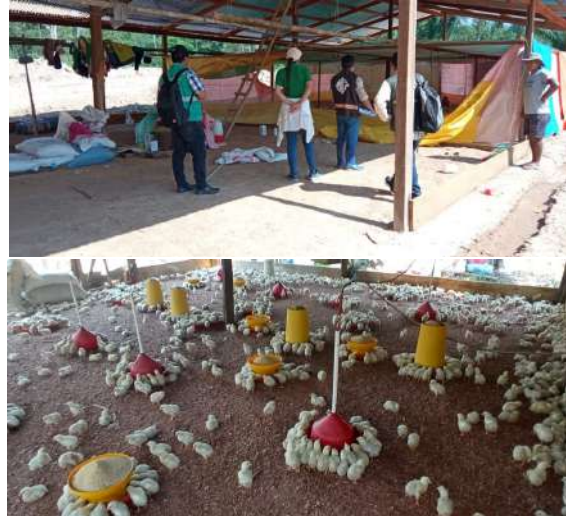
Inspección de granjas avícolas de nuestra población.