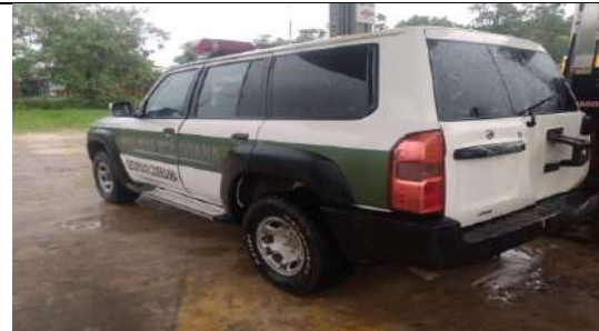
Entrega de combustible a la policía Nacional.