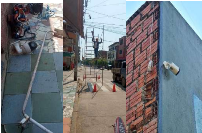
Mano de obra servicio mantenimiento correctivo de 9 cámaras software y hardware de los sistemas de monitoreo de Rurrenabaque