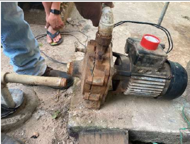
Mantenimiento y reparación de bomba eléctrica para mercado central