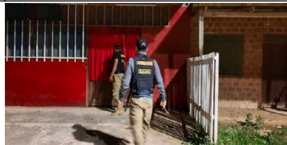
Control nocturno para hacer cumplir Ley Nacional 259.