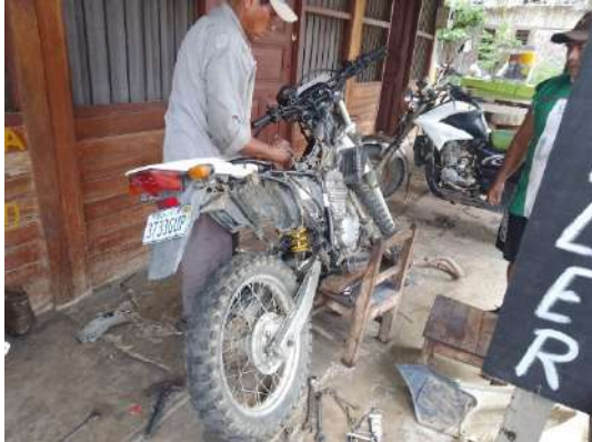
Mantenimiento de motocicletas de la policia nacional.