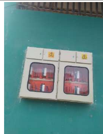
Mejoramiento del Mercado Rurrenabaque de Villa Lourdes, cambio del sistema eléctrico completo.