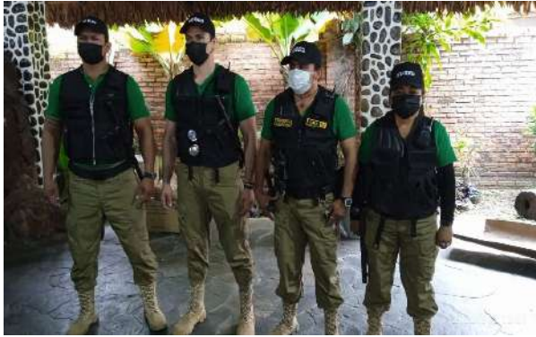
Adquisición de prendas de vestir para gendarmes