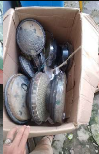
Mantenimiento de semáforos.