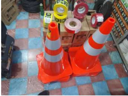
ADQUISICIÓN MATERIAL PARA USO DE SEGURIDAD CIUDADANA (precintos, conos, cinta reflectiva y otros)