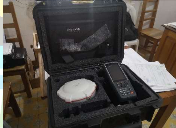
Entrega de equipo GPS-RTK-REAL TIME KINEMATIC