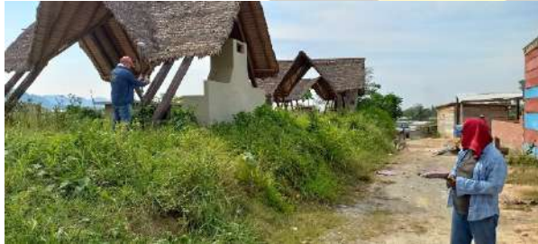
Verificación de límites del predio de centro recreativo La Laguna con el uso de equipo GPS-RTK-REAL TIME KINEMATIC