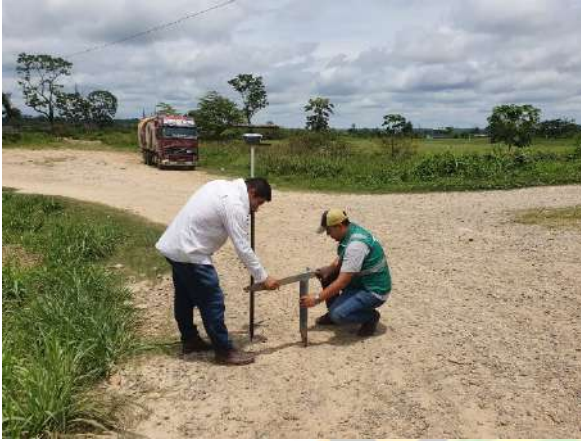
Verificación de límites del predio de campo ferial con el uso de equipo GPS-RTK-REAL TIME KINEMATIC