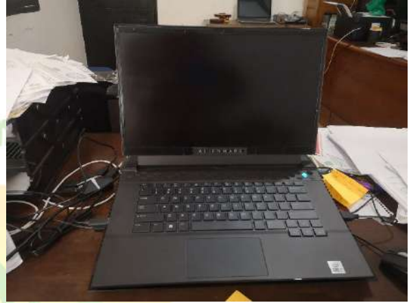
Adquisición de equipo de computación portátil para la Dirección de Catastro y Planificación Urbana.