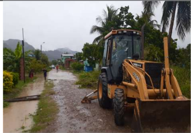
Apertura de Cunetas con Maquinaria