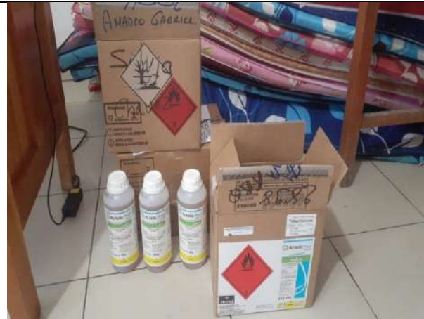
Compra de Insecticida