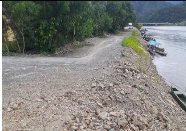
Relleno de Protección Av. Costanera Barrio San José