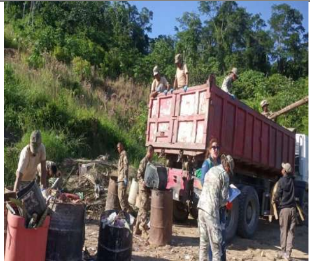
Alquiler de Volquetas para 2da Campaña de Limpieza Contra el Dengue