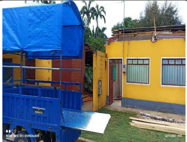
Ayuda Humanitaria por Fuertes Vientos – Dotación de Calamina.