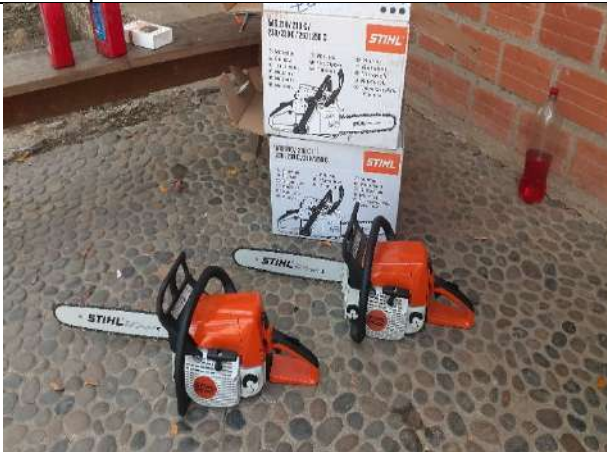
Compra de Motosierras.