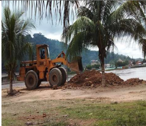
Relleno de Protección Av. Costanera Zona Central