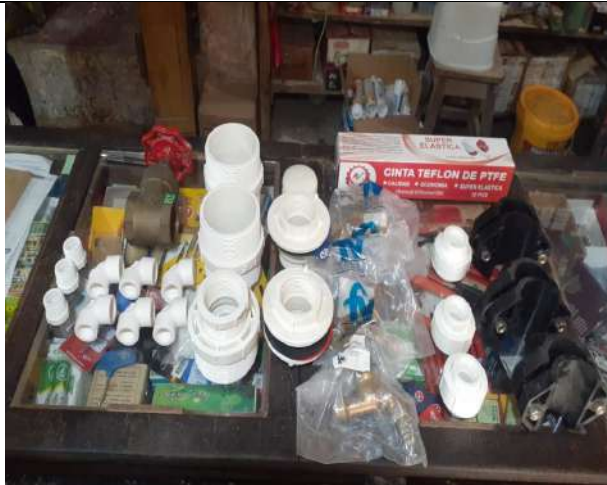
Implementos para el Sistema de Agua C. Asunción del Quiquibey.