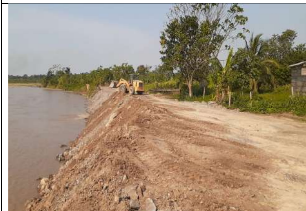
Relleno de Protección Av. Costanera Isla Grande.