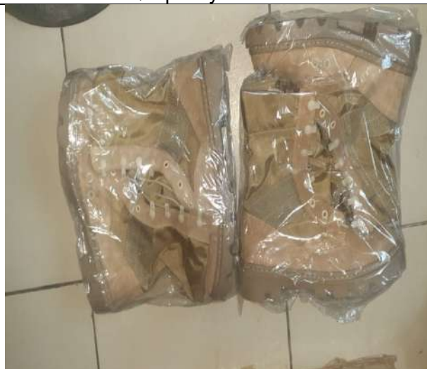
EPP Para Personal de Primera Respuesta Municipal.