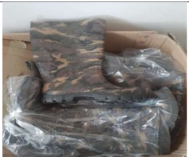
EPP Para Personal de Primera Respuesta Municipal.