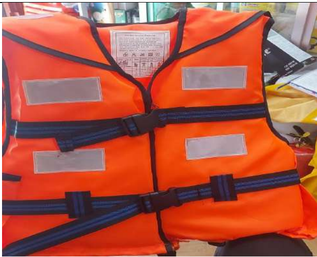
Compra Chalecos Salvavidas.