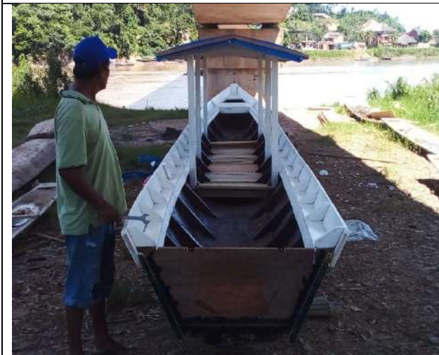
Compra de Embarcación Municipal.