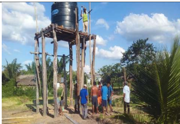
Sistema de Agua Potable Comunidad Indígena Santa Rosita.