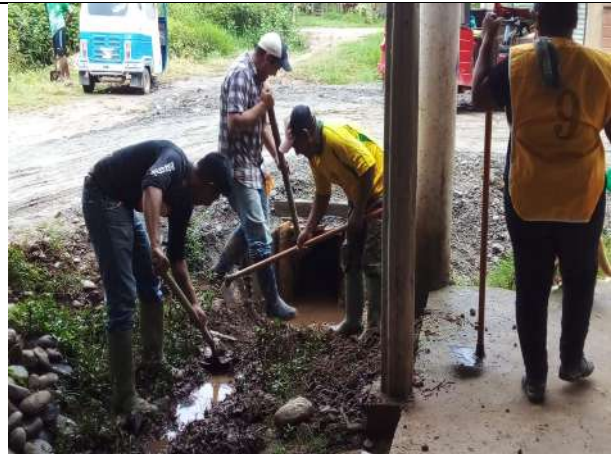
Limpieza de Cunetas por Emergencias de Inundaciones.