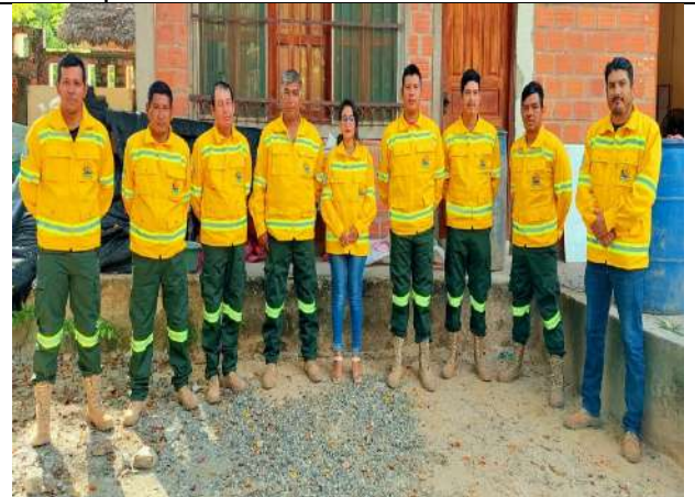
EPP Para Personal de Primera Respuesta Municipal.